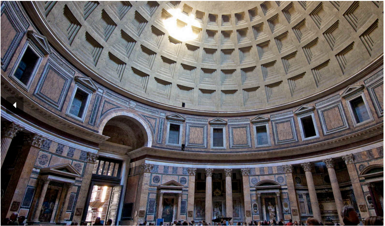
Ρώμη, Πάνθεον. Κτίστηκε από τον Μάρκο Αγρίππα επί Αυγούστου (27 π.Χ. - 14 μ.Χ.) και ολοκληρώθηκε πιθανότατα το 126 μ.Χ. από τον Ανδριανό (117-138 μ.Χ.). Τρούλλος διαμέτρου 43,3 μ. επάνω σε κυλινδρική βάση.