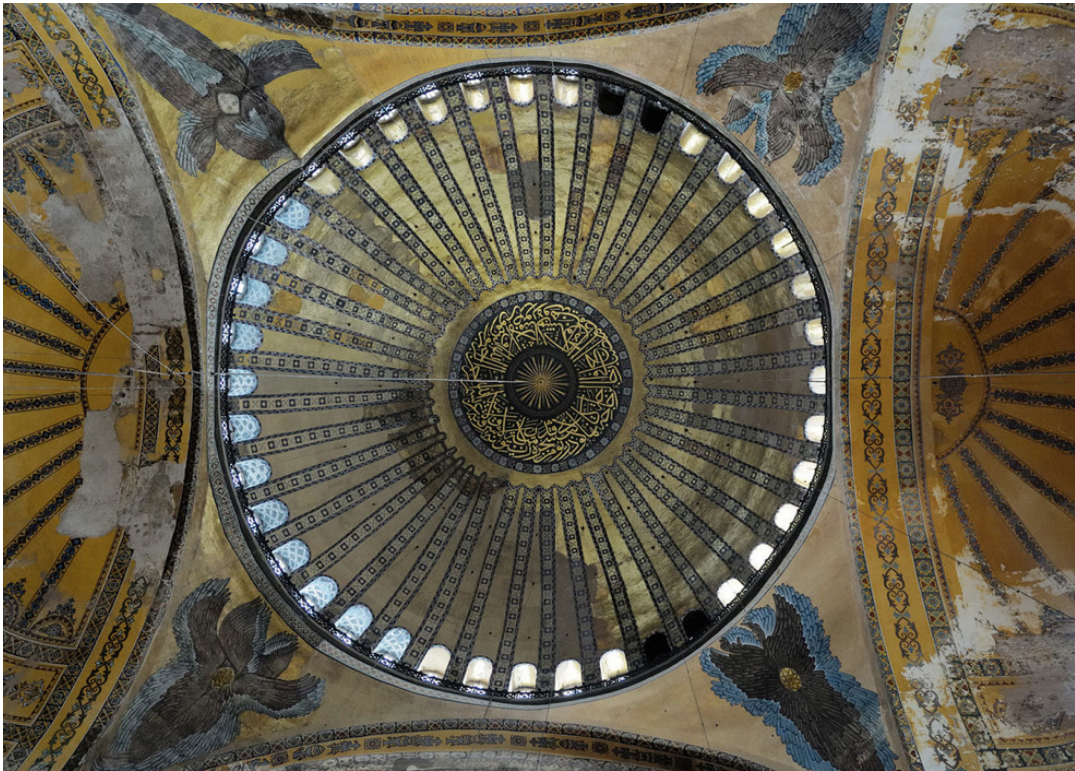
Κωνσταντινούπολη, Αγία Σοφία. Κτίστηκε από τον Ιουστινιανό Α' και εγκαινιάστηκε στις 27 Δεκεμβρίου 537. Τρούλλος διαμέτρου 31 μ. επάνω σε τετράγωνη βάση, μεσολαβούντων τεσσάρων τόξων και τεσσάρων σφαιρικών τριγώνων. Κατέπεσε από σεισμό το 557 και ο ναός επισκευάστηκε και εγκαινιάστηκε για δεύτερη φορά το 563.